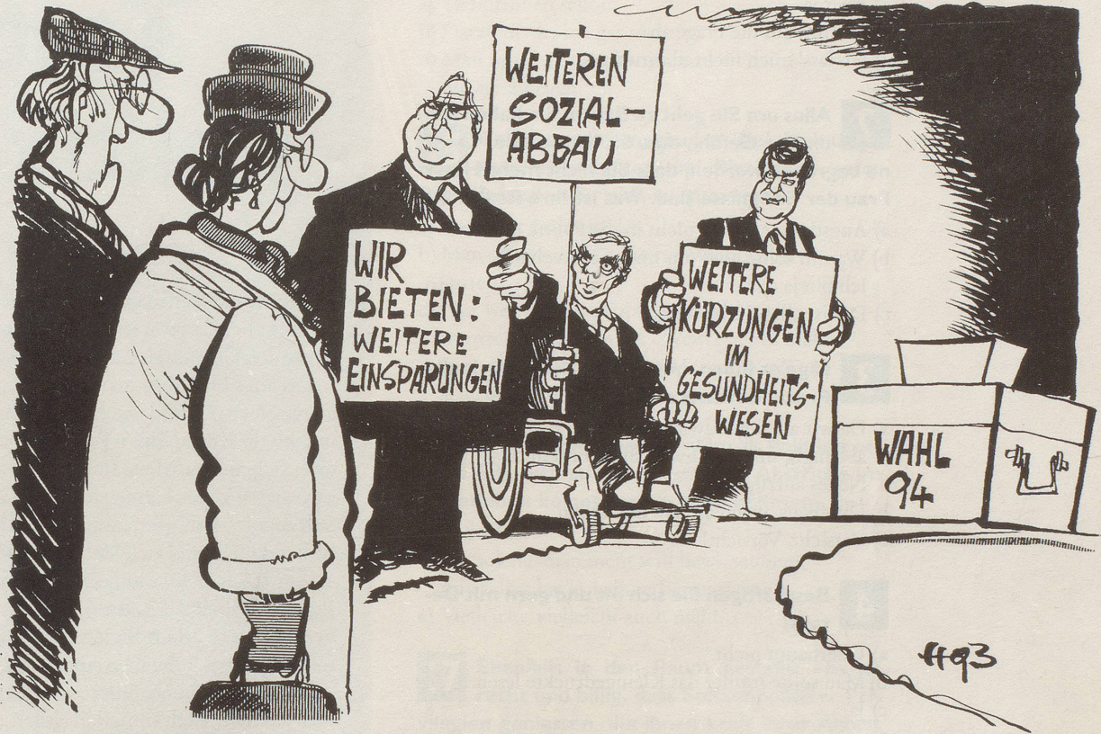
«Auch die Wahlversprechen sind nicht mehr, was sie einmal waren!»