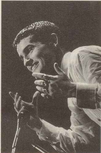
Penetrant tuntig: Ööörsli

Die «Geschwister Pfister» sind nicht mehr. Doch «Örsli» is back und strapaziert unsere Nerven ganz arg. Ursli, der jüngste der vier «Waisenkinder», ist jetzt nämlich ein Star. Das ist ihm entschieden zu Kopf gestiegen. Seinen Bruder Toni und das «Froilain Schneider» im Schlepptau, kurvt er durch die Lande und geniesst vor allem eines: dass er nicht mehr im Schatten