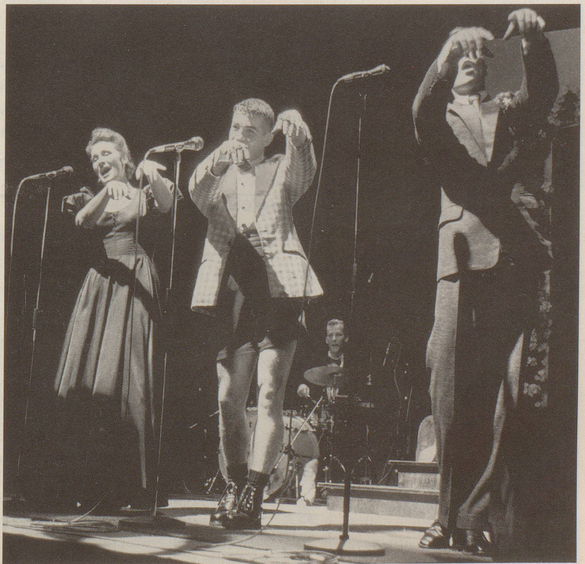
Fescher Bubi mit einer Show, die nach 15 Minuten auseinanderfällt.