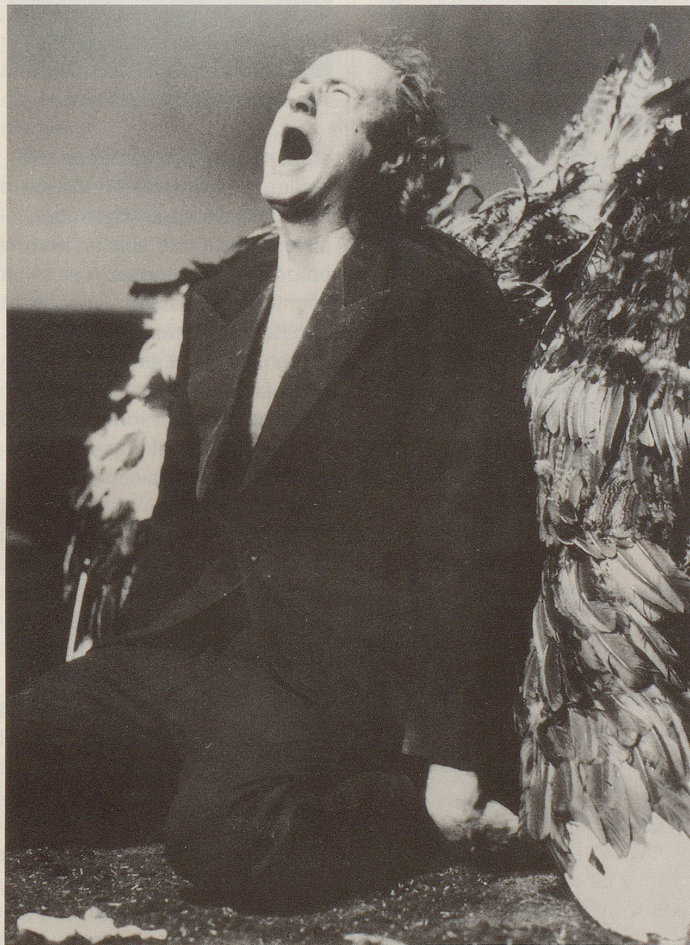
Der unerwünschte Fremde muss seine Andersartigkeit büssen.