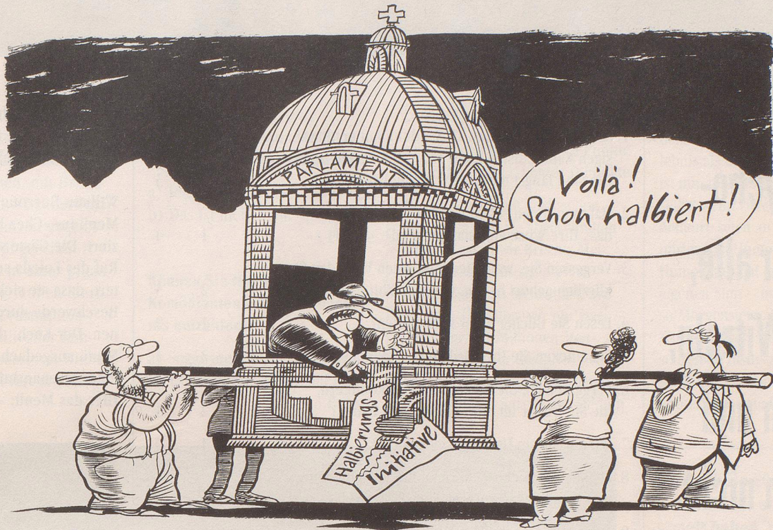
Militärausgaben-Halbierungs-Initiative auch vom Nationalrat für ungültig erklärt.