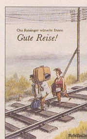
Otto Reisinger Gute Reise! Cartoons 108 S., Fr. 12.80 2. Auflage