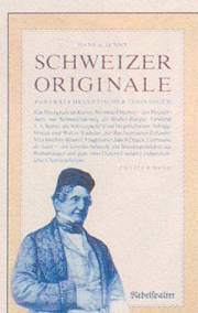
Hans A. Jenny Schweizer Originale Zweiter Band Weitere Porträts helvetischer Individuen 128 S., Fr. 14.80 2. Auflage