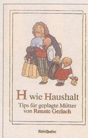
Renate Gerlach H wie Haushalt Tips für geplagte Mütter 94 S., Fr. 12.80 2. Auflage