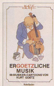
Kurt Goetz Ergoetzliche Musik 99 Musiker-Cartoons von Kurt Goetz 128 S., Fr. 9.80 2. Auflage