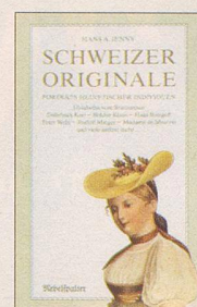
Hans A. Jenny Schweizer Originale Erster Band Porträts helvetischer Individuen, 120 S., Fr. 14.80, 3. Auflage