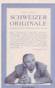
Hans A. Jenny Schweizer Originale Dritter Band Noch mehr Porträts helvetischer Individuen 128 S., Fr. 14.80 2. Auflage