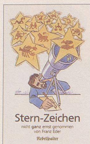
Franz Eder Stern-Zeichen Cartoons 96 S., Fr. 12.80