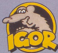
Abbildung in Originalgrösse