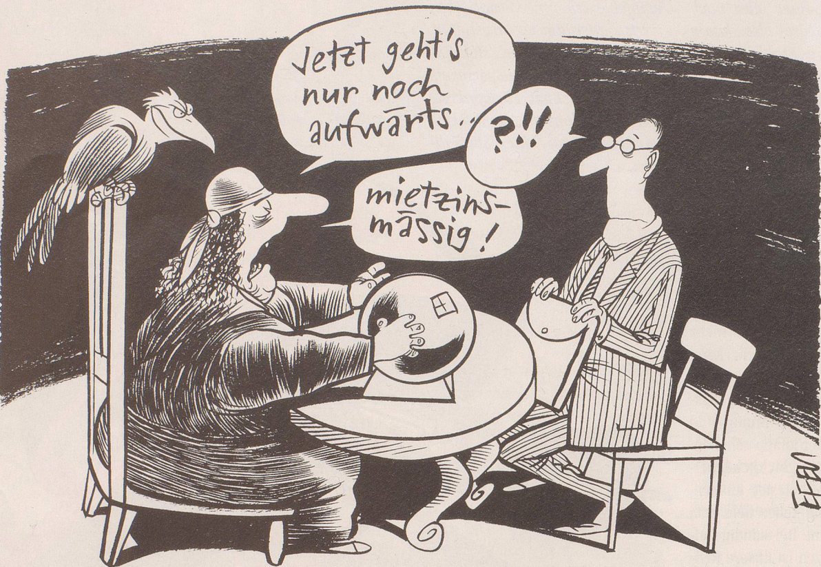
Hypothekarzins-Senkungen müssen (laut Bundesgericht) nicht mehr an die Mieter weitergegeben werden.