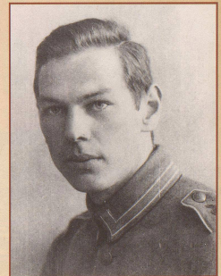
Richard Sorge im 1. Weltkrieg 1916