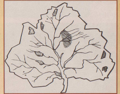
Ein militärischer Plan in Form eines Baumblattes