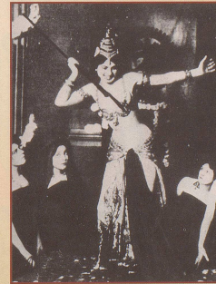
Mata Hari zu ihrer Glanzzeit

Von diesen 28 Milliarden erhält die CIA drei Milliarden. Geld garantiert kein Fortüne. Wir wissen inzwischen, dass über neun Jahre der «Maulwurf» Aldrich Ames 100 Geheimoperationen verrichtete. Dutzende Agenten gingen dabei hops.