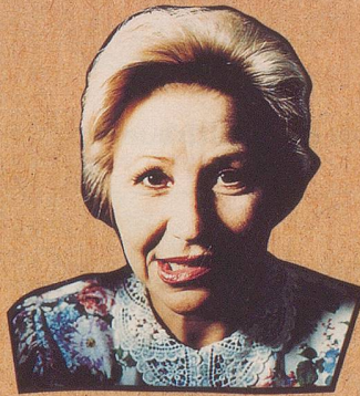
In Mallorca haben sie's nicht.