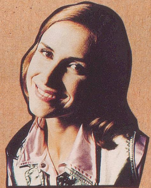
Der Mieter von Nebenan hat's.