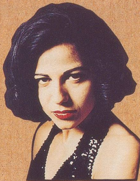
Der mit den weissen Socken hat's nicht.