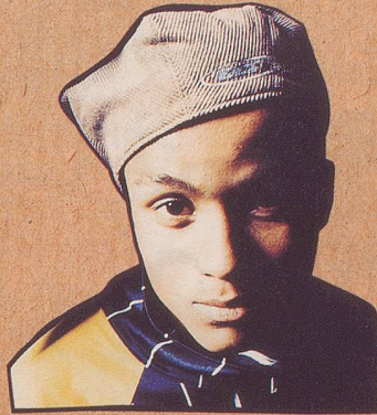
Seine Leadsängerin hat's.