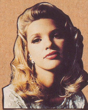
Ihr Hausmann hat's.