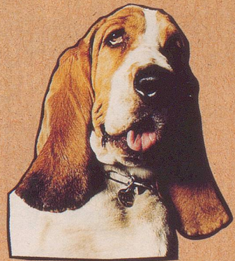
Sein Briefträger bringt's ihm.