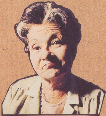
Ihre Haushilfe hat's nicht.