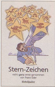
Franz Eder Stern-Zeichen Cartoons 96 S., Fr. 12.80