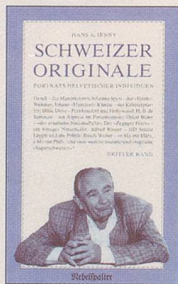
Hans A. Jenny Schweizer Originale Dritter Band Noch mehr Porträts helvetischer Individuen 128 S., Fr. 14.80 2. Auflage