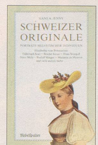
Hans A. Jenny Schweizer Originale Erster Band Porträts helvetischer Individuen, 120 S., Fr. 14.80, 3. Auflage