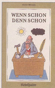
Hans Moser Wenn schon, denn schon Schmunzelgeschichten mit Cartoons des Autors 128 S., Fr. 14.80