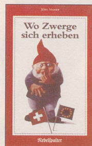
Jürg Moser Wo Zwerge sich erheben Satiren 128 S., Fr. 14.80