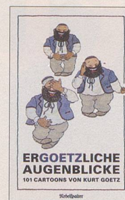
Kurt Goetz Ergoetzliche Augenblicke 101 Cartoons von Kurt Goetz