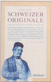
Hans A. Jenny Schweizer Originale Zweiter Band Weitere Porträts hel- vetischer Individuen 128 S., Fr. 14.80 2. Auflage