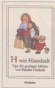
Renate Gerlach H wie Haushalt Tips für geplagte Mütter 94 S., Fr. 12.80 2. Auflage