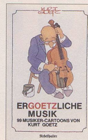
Kurt Goetz Ergoetzliche Musik 99 Musiker-Cartoons von Kurt Goetz 2. Auflage