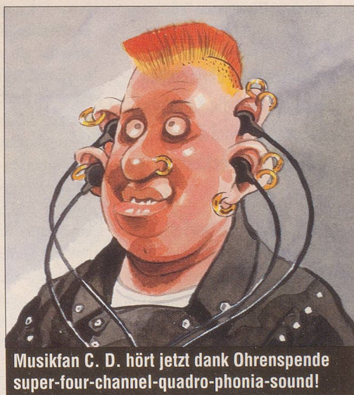
Musikfan C. D. hört jetzt dank Ohrenspende super-four-channel-quadro-ponia-sound!

S'CHRÖTTLI meint: Ich habe etwas für Frochschenkel-Liebhaber gespendet!