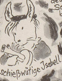
die schießwütige Isabell