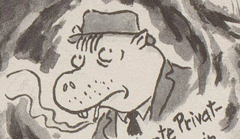
der berühmte Privatdetektiv Snuffy, in dessen Agentur Sam seine Auszubildung machte