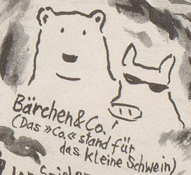
Bärchen & Co. (Das »Co.« stand für das kleine Schwein)