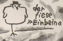
der fiere »Einbein«