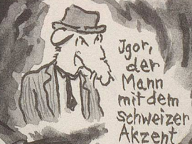
Jgori, der Mann mit dem Schweizer Akzent