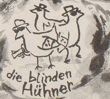
die blinden Hühner