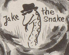
Jake the Snake