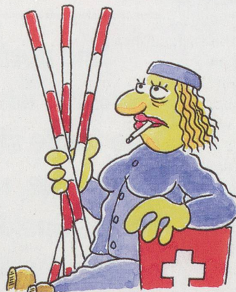
... Neuenburg: "Natur und Künstlichkeit". Künstliche Schilf= halme werden zu authentischen Strassenmarkierungsstangen.

Vom Computer errechnete, etwas kosten= günstigere Synthese aller.