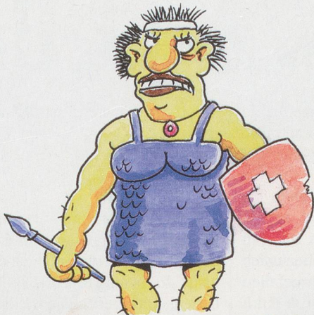
Motto der Arteplage in Biel: "Macht und Freiheit"