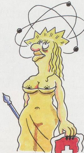
... Yverdon: sinnliches "Ich und das Universum"