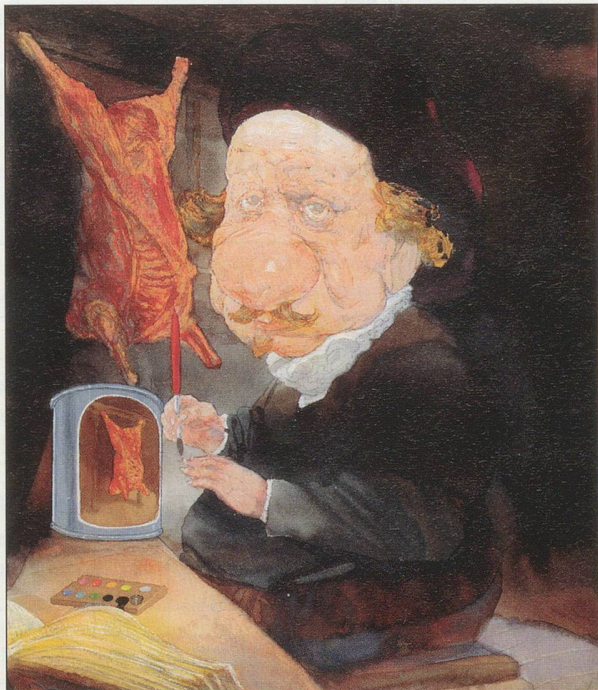
Rembrandt Harmensz van Rijn