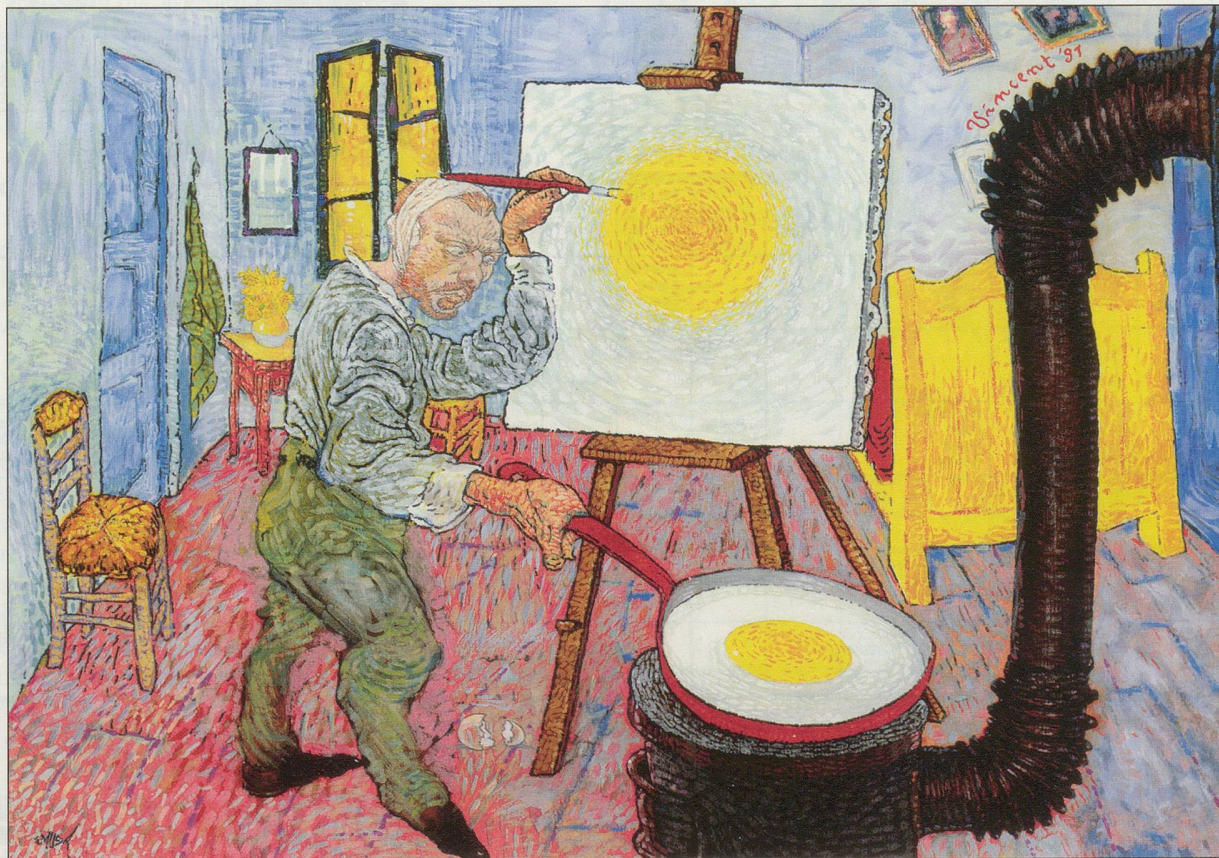
Vincent van Gogh