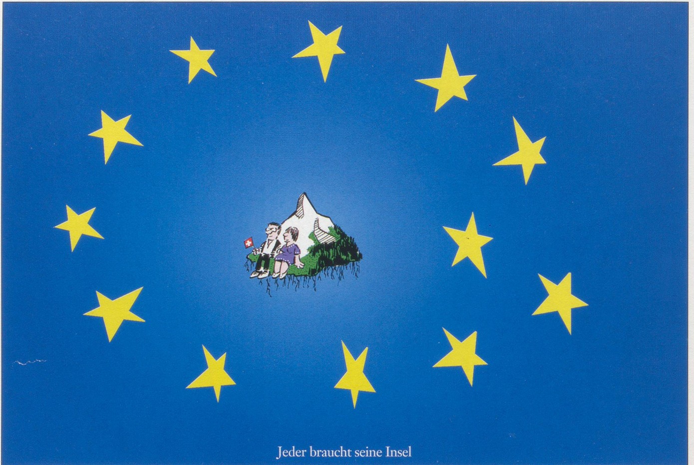
Jeder braucht seine Insel