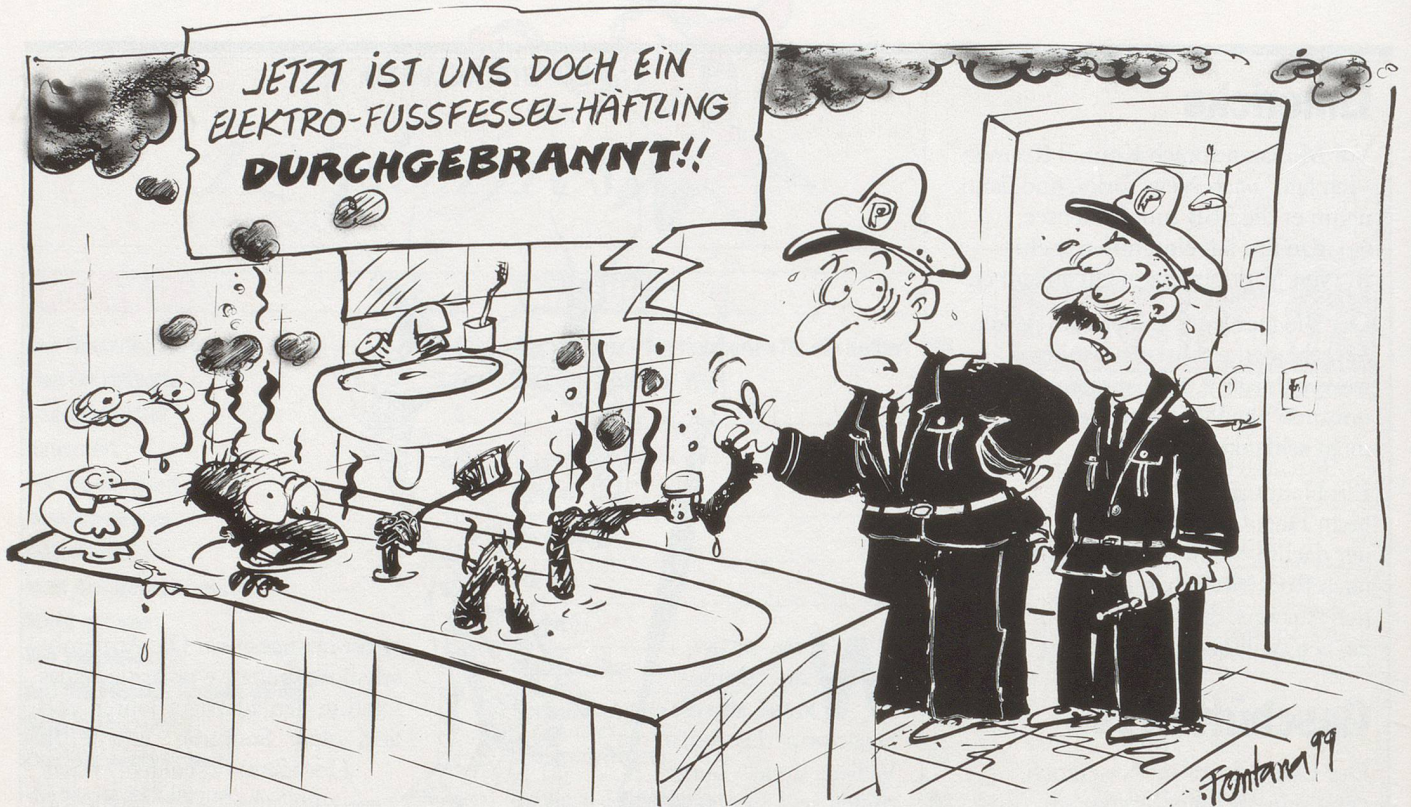
Auch in der Schweiz ist die Einführung der elektronischen Fussfessel für Häftlinge vorgesehen.