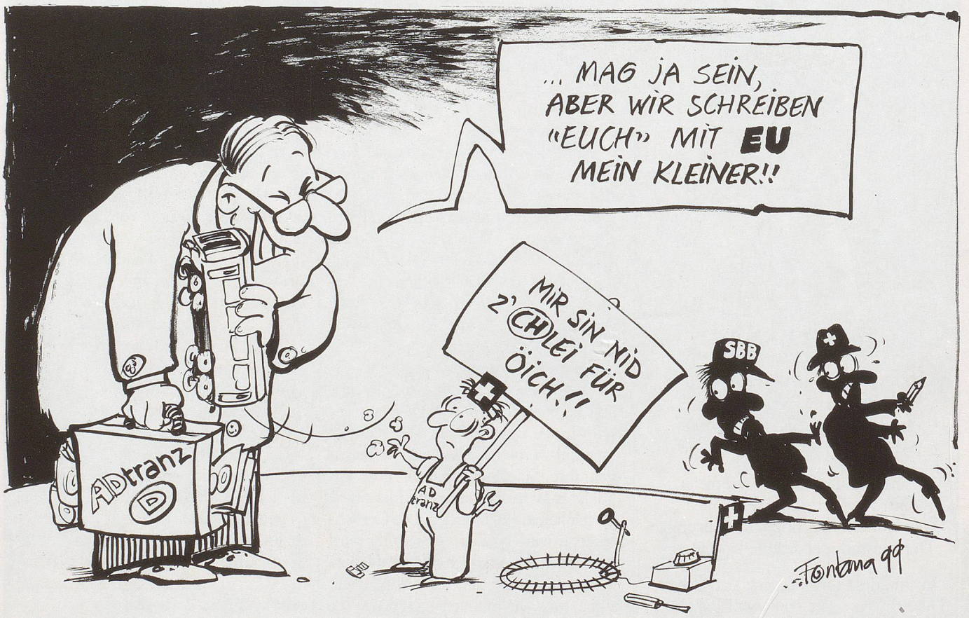
Adtranz D gegen Adtranz CH oder Eigeninteressen kommen vor Qualität.