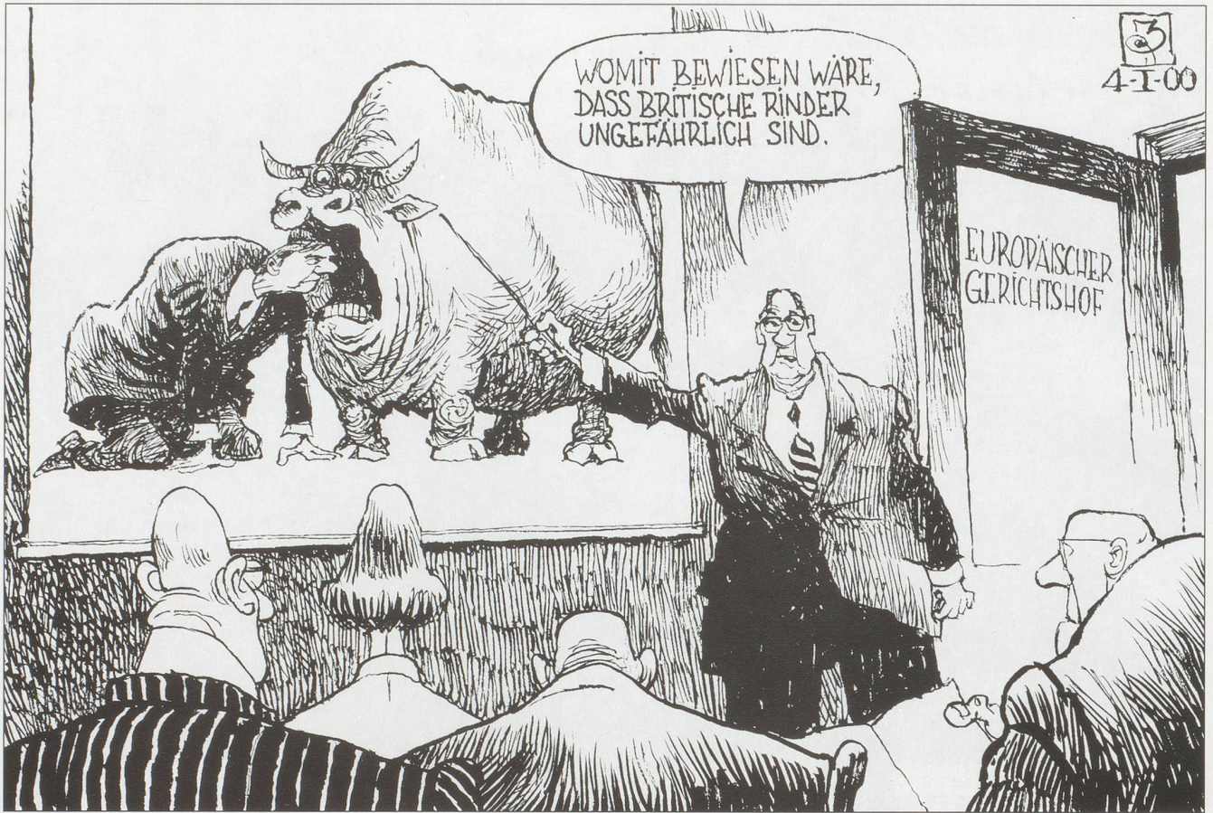
Die EU-Kommission verklagt Frankreich, weil es sich weigert, britisches Rindfleisch zu importieren.