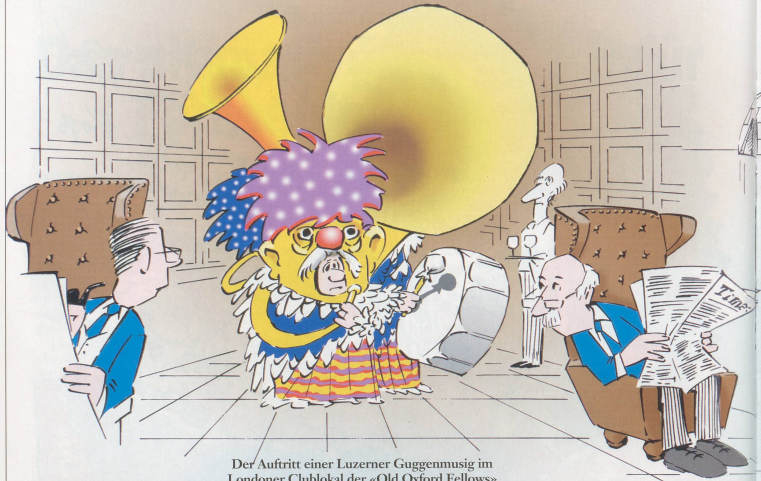
Der Auftritt einer Luzerner Guggenmusig im Londoner Clublokal der «Old Oxford Fellows» soll nur begrenzt ein Erfolg gewesen sein.