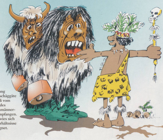
Eine Abordnung der Lötschentaler Tschägätsche wurde in Burundi vom Vorsitzenden des Nationalen Medizinmänner-Verbands herzlich empfangen. Ihre Bekleidung erwies sich leider für dortige Verhältnisse als eher ungeeignet.