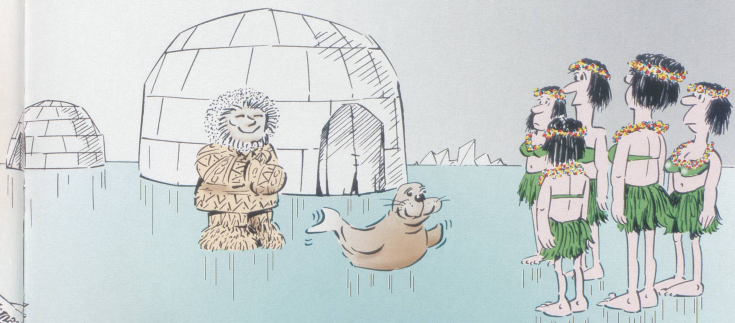
Die Damenriege des TV Inwil durfte ihr diesjähriges Sujet «Hawaii Girls» in einem Gastland präsentieren. Dabei wurde der Name des Gastlandes vom Reise-OK zwar korrekt aber missverständlich mit «Grünland» übersetzt.