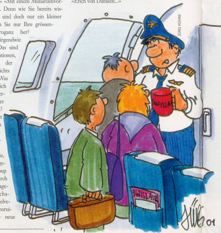
«Darf ich noch um eine kleine Spende bitten?»

Firma soll nun, so der Bund, die Banken und die Industrie wollen, wie einst Phönix aus der Asche zu neuem Leben erweckt werden.» «Und wie in aller Welt wollen Sie das bewerkstelligen?» «Unser traditionell-schweizerischer Tourismus mit seinem Alphon- und Edelweiss-Image dümpelt so gemächlich dahin, an revolutionär-visionären Ideen hapert es ganz erheblich. Unter der Ägide von Topshots aus der monetären Businesswelt und unter Berücksichtigung von supermerkantilistischem Kalkül soll das grösste europäische multikulturelle Airline Grounding World and Game Center entstehen. Zudem möchten Las Vegas an unserem Projekt kreativ mitgestalten.» «Moment mal! Haben Sie öfter derart himmrissige Sciencification-Wahnideen?» «Das ist kein Wahn! Das ist eine zukunftsweisende Überlebensstrategie für Schweiz Tourismus. Unsere Devise lautet: Wie schlage ich aus gestrauchten Firmen Kapital zur Förderung und Sicherung unserer bald noch einzig verbleibenden Ressource Tourismus.» «Sagen Sie, wie war doch gleich Ihr Name?» «Erich von Däniken...»