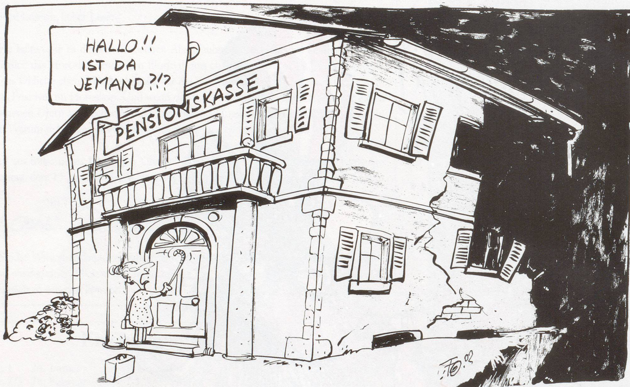
Alles verschenkt! Mit etwa 50 Milliarden Franken Börsenverlust stehen viele Pensionskassen dicht am Abgrund.