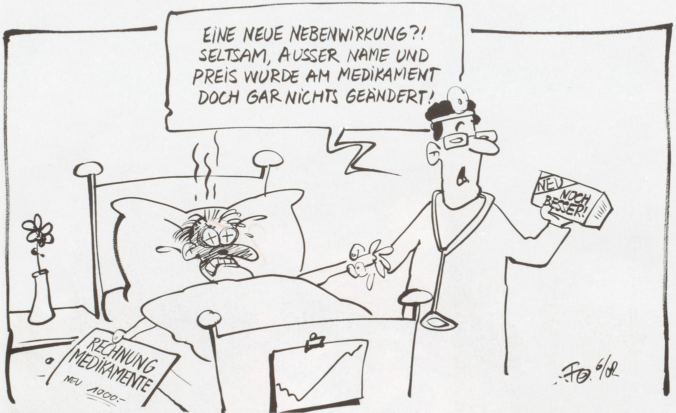
Neue Medikamente? Für rund 400 alte Medikamente sind patentgeschützte Kopien auf dem Markt. Pharmaunternehmen vermeiden damit Preissenkungen...