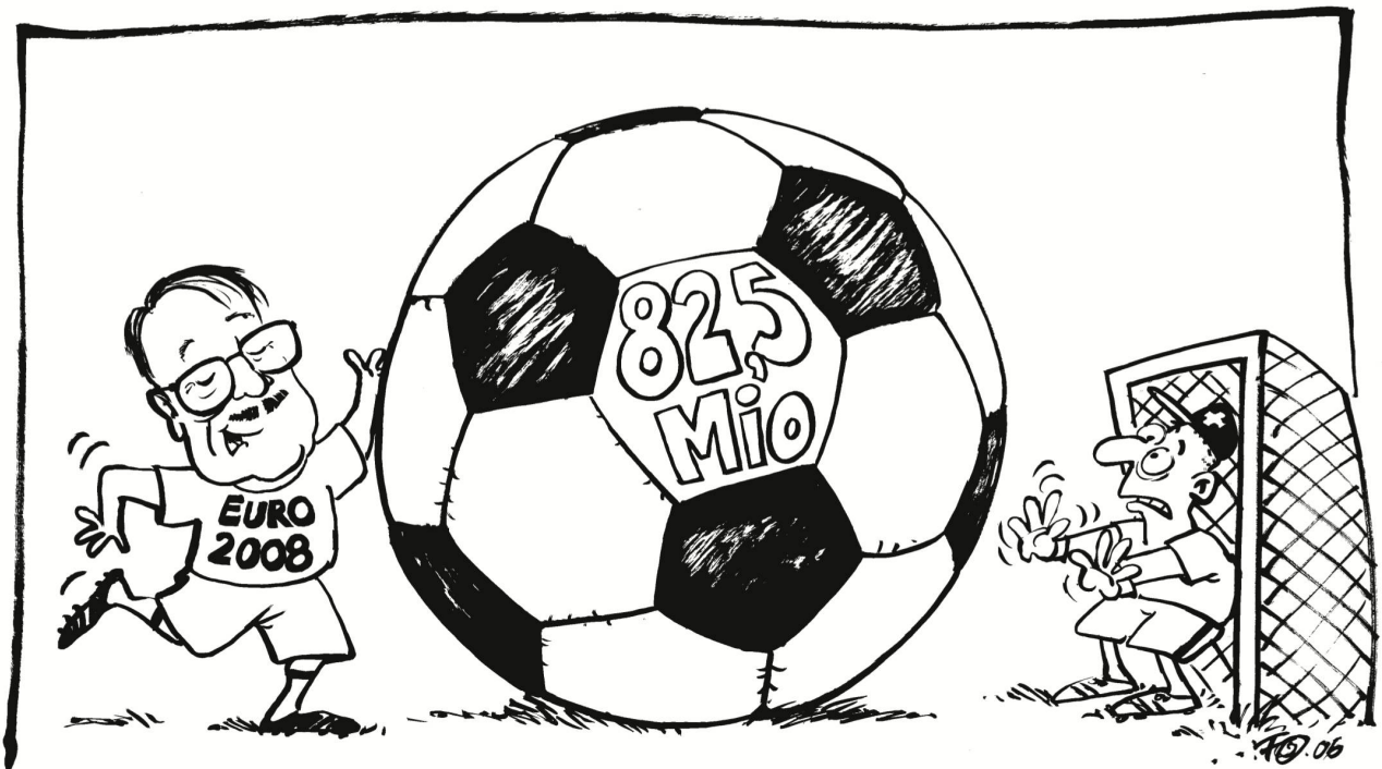
Trotz Kritik bewilligt der Nationalrat den Kredit für das «Fussballfest». Den Sportminister freuts.