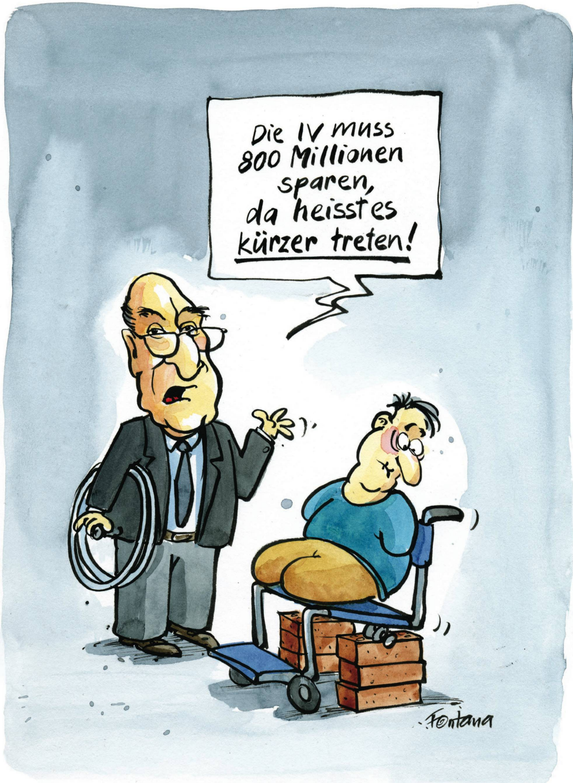
Um das Millionendefizit der Invalidenversicherung zu decken, werden Leistungskürzungen in Betracht gezogen.