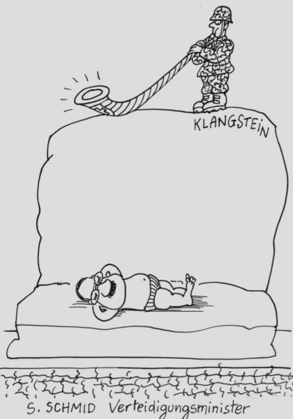
S. SCHMID Verteidigungsminister