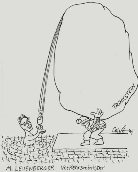
M. LEUENBERGER Verkehrsminister