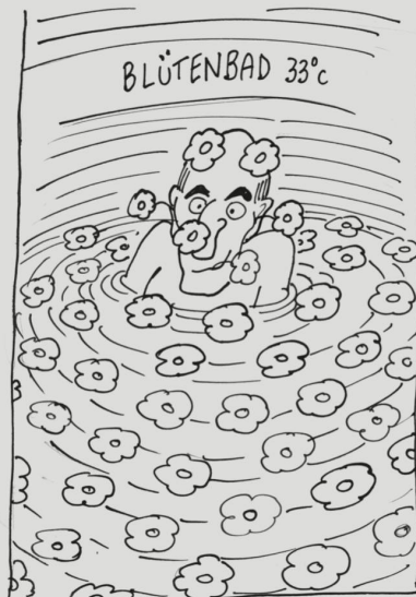
H. R. MERZ Finanzminister