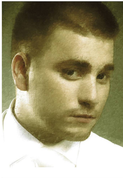
Abb. 2: Porträt des jungen Sängers Baschi von Hans Holbein dem Älteren (um 1516). Augsburger Staatsgalerie

Vielleicht hätte König Artus besser Deutsche auf die Suche nach dem Heiligen Gral mitgenommen. Diese sind dabei ziemlich erfolgreich und haben eine lange litera-