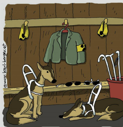
BLICK IN DIE SCHIEDSRICHTER-GARDEROBE