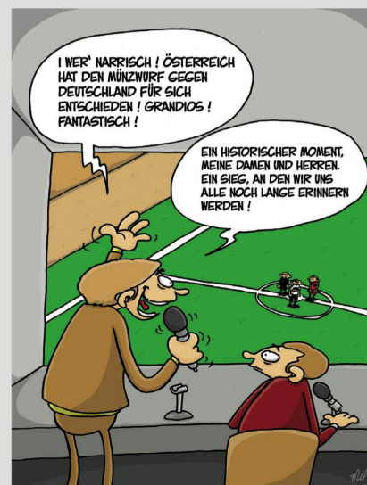
I WER' NARRISCH ! ÖSTERREICH HAT DEN MÜNZWURF GEGEN DEUTSCHLAND FÜR SICH ENTSCHEIDEN ! GRANDIOS ! FANTASTISCH !