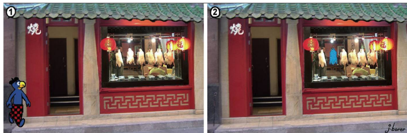
Aus der Serie «Schreckliche Bilder»: Ein Schweizer Tourist in Peking