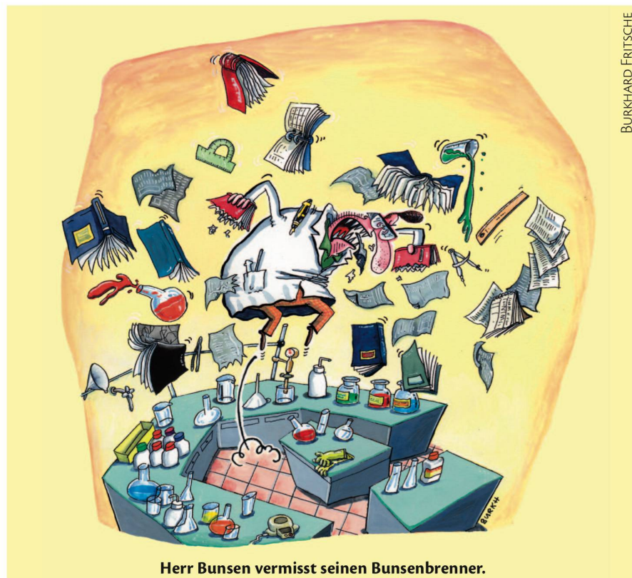
Herr Bunsen vermisst seinen Bunsenbrenner.