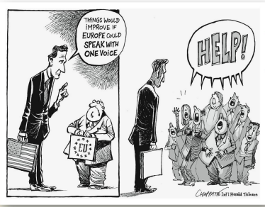
Patrick Chappatte International Herald Tribune «Vieles würde einfacher, wenn Europa mit einer Stimme spräche.»