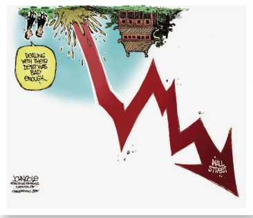
John Cole | USA China: Sich auf die US-Schulden einzulassen war eine schlechte Idee.