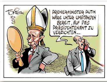
Jürgen Tomick | Deutschland Putins Machthunger oder der Papstin.