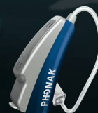
Abbildung: Audeo S MINI Hörgerät in Originalgrösse.

www.phonak.ch/hoeren Hörverlust ist kein Grund zur Sorge, aber ein Grund zum Handeln.