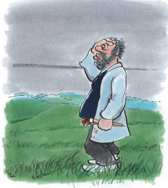
Blöder Künstler – nach England gefahren und Grau und Grün vergessen...