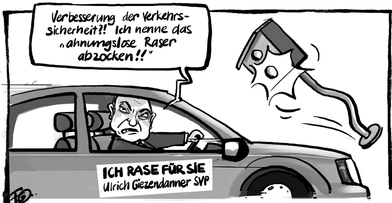
Rund die Hälfte der Radaranlagen auf Schweizer Autobahnen dienen nur dazu, Bussen zu kassieren, deshalb sollen sie abgebaut werden. Das verlangt der SVP-Nationalrat Ulrich Giezendanner.