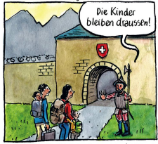
So werden die Einwanderungen halbiert.