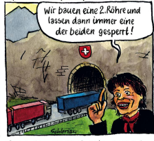
So werden die Einfahrten halbiert.