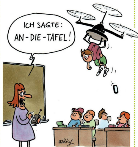
DROHNEN IM UNTERRICHT