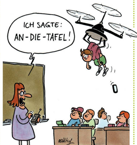
DROHNEN IM UNTERRICHT