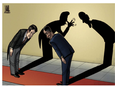
Luojie | China, China Daily Obama auf Asien- Tournee zu Besuch in Japan.