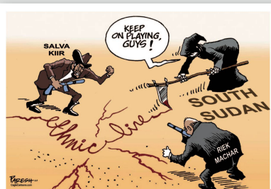
Paresch Nath Vereinigte Arabische Emirate Südsudan: Der schon wieder fast vergessene Konflikt.