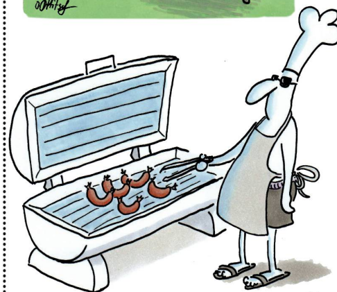
GRILLEN IM WINTER