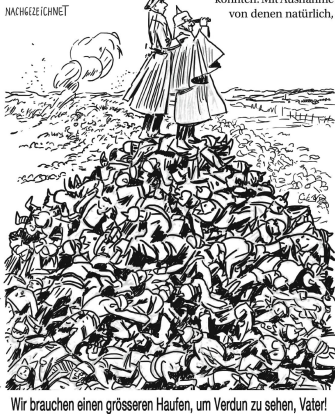
Wir brauchen einen grösseren Haufen, um Verdun zu sehen, Vater!

Chor der Toten schrieb: «Wir Toten, wir Toten sind grössere Heere / Als ihr auf dem Erde, als ihr auf dem Meere.»