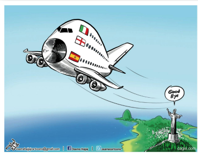
Darüber lacht die ganze Welt: WM-Ausscheiden der Top-Favoriten