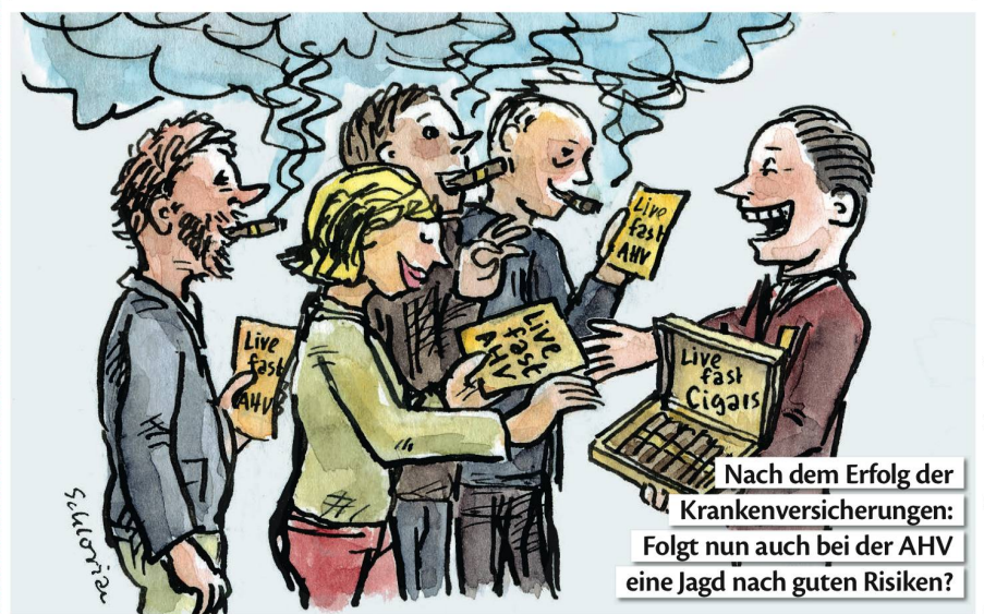
Nach dem Erfolg der Krankenversicherungen: Folgt nun auch bei der AHV eine Jagd nach guten Risiken?