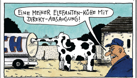
Hoch spezialisierte Landwirtschaft