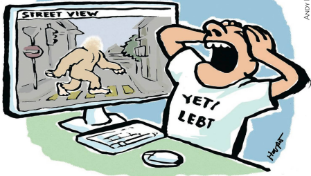
BEINAHE HÄTTE STREET VIEW DIE EXISTENZ DES YETI BEWIESEN.