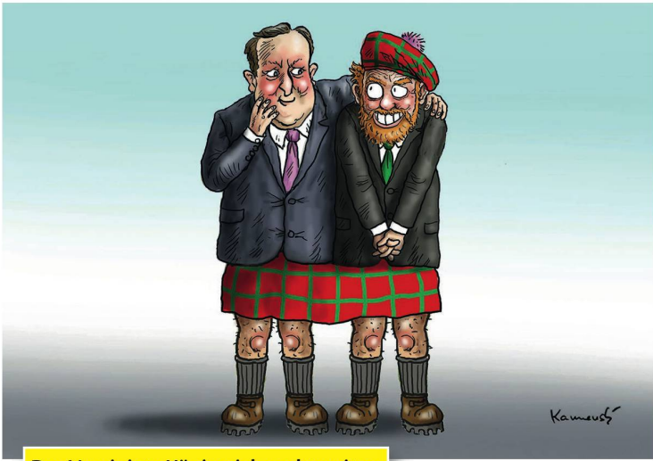
Das Vereinigte Königreich rockt weiter.