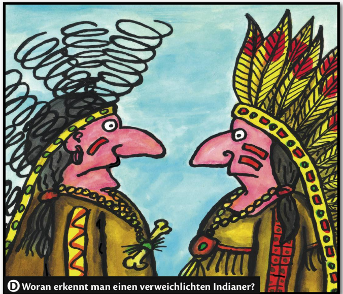
D Woran erkennt man einen verweichtlichen Indianer?