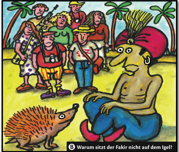
B Warum sitzt der Fakir nicht auf dem Igel?