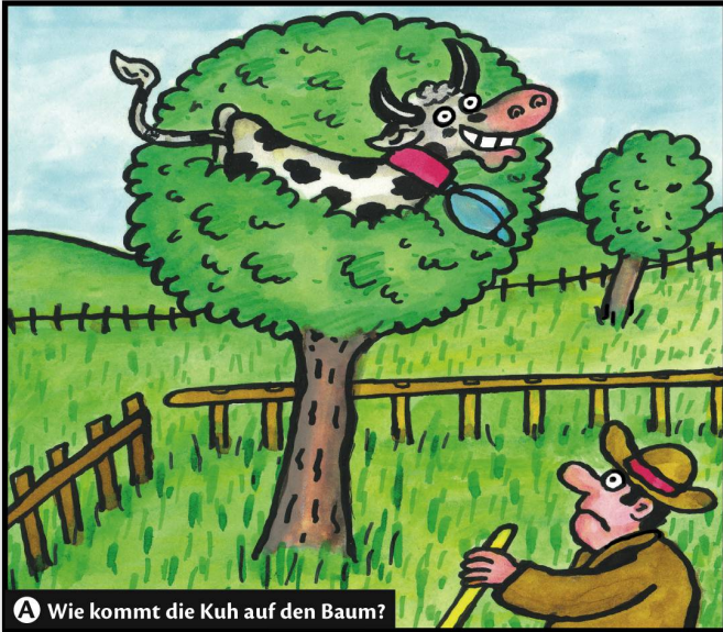
A Wie kommt die Kuh auf den Baum?