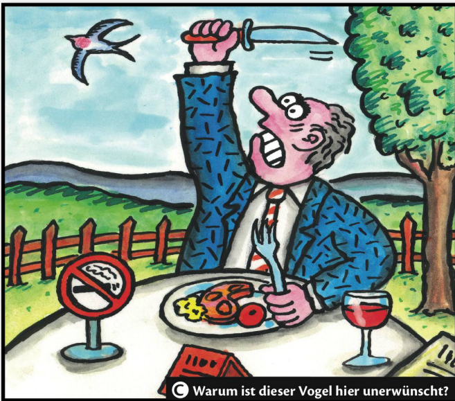
C Warum ist dieser Vogel hier unerwünscht?