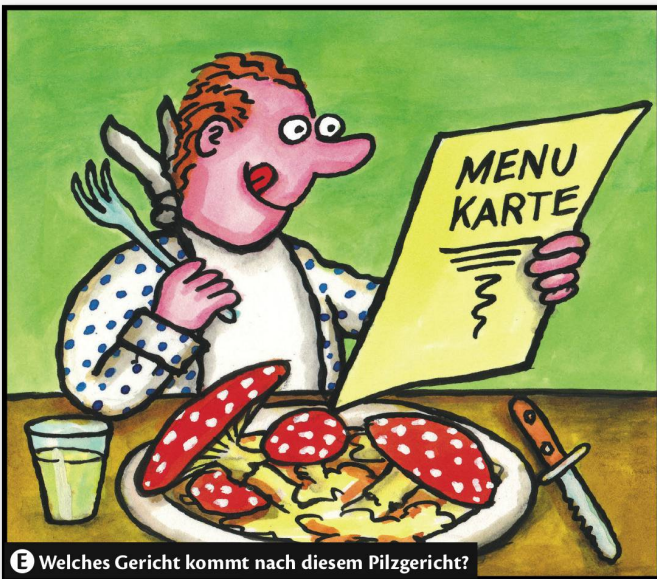
E Welches Gericht kommt nach diesem Pilzgericht?