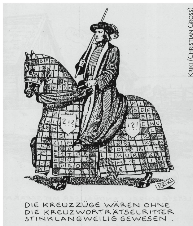
DIE KREUZZÜGE WÄREN OHNE DIE KREUZWORTRÄTSELRITTER STINKLANGWEILIG GEWESEN.