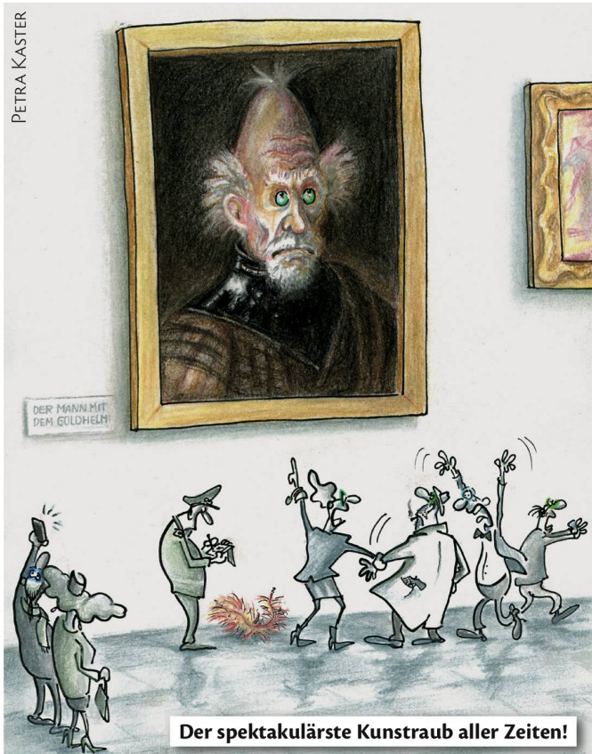
Der spektakulärste Kunstraub aller Zeiten!