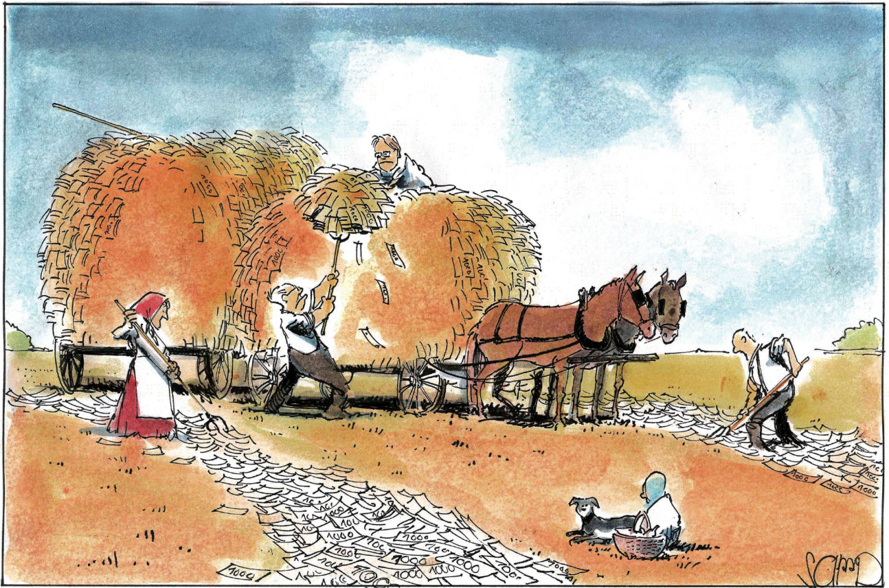
ALBERT ANKER: GELD WIE HEU (Privatbesitz)