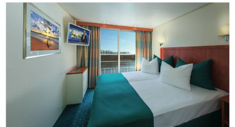
2-Bettkabine Mittel- und Oberdeck Superieur mit franz. Balkon

* Im Ausflugspaket (Fr. 180.-) enthalten, vorab buchbar | * Fak. Ausflug nur an Bord buchbar | Programmänderungen vorbehalten | Reederei/Partnerfirma: River Advice