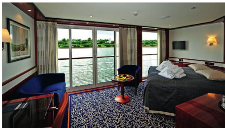
Deluxe Suite (22 m 2 ) mit franz. Balkon