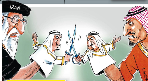
Säbelrasseln im Nahen Osten