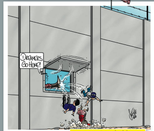
Mauer mit Babyklappe