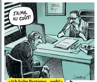
«Ich habe Portemo...weh!»