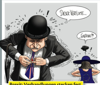
Brexit: Verhandlungen stecken fest