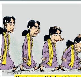
Mutation einer Nobelpreisträgerin