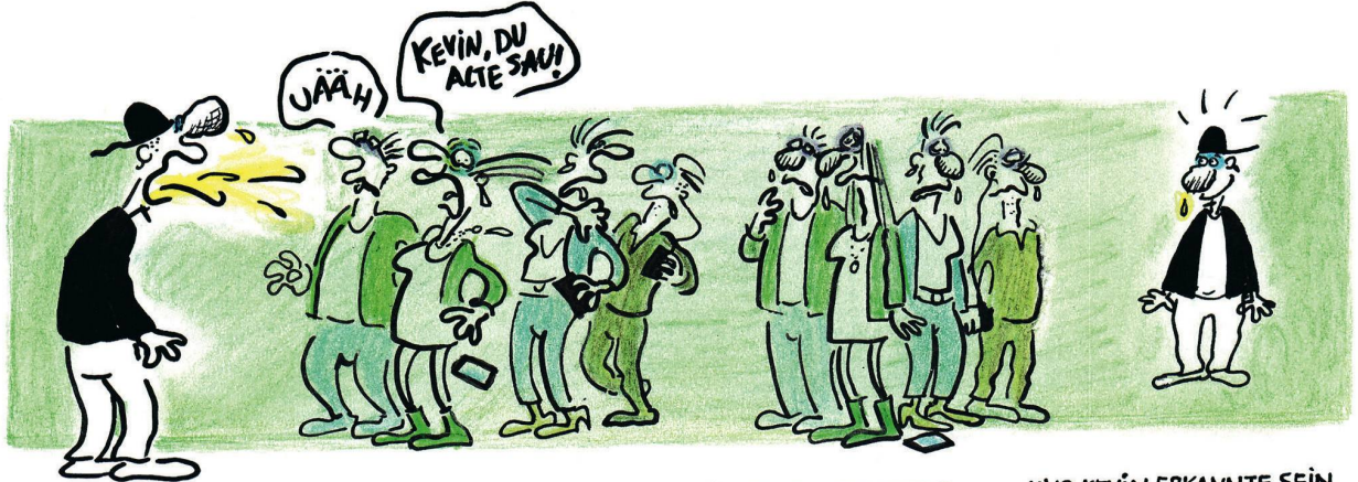
FREUNDE BEKAM ER SO NICHT...